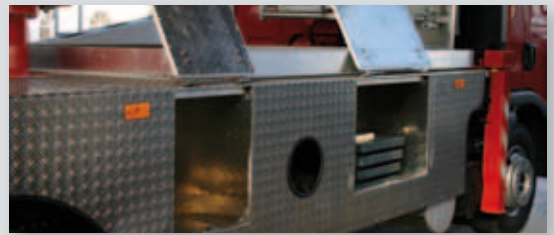
... SICHER & ATTRAKTIV!