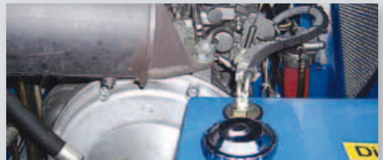
... SPARSAM & UMWELTFREUNDLICH!