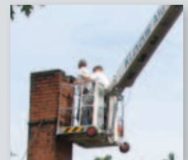
... CLEVER & FLEXIBEL!