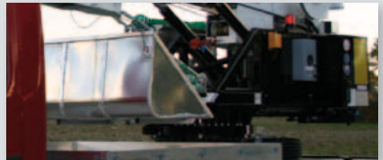
... PRAKTISCH & VARIABEL!